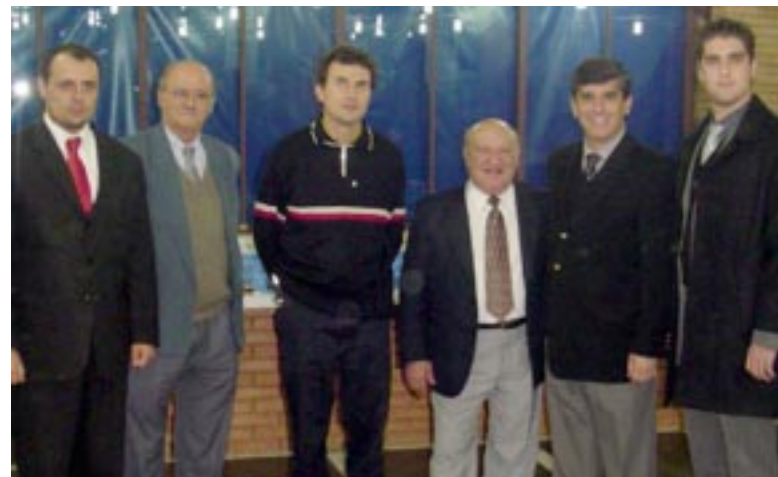
Empresários e autoridades prestigiaram o evento