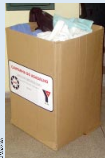
Caixa de arrecadação de agasalhos