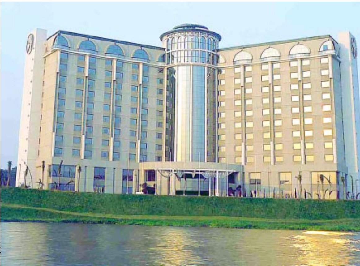
Local do evento: Hotel Caesar Park

A Primeira Rodada de Negócios de Cumbica-Guarulhos promovida pela Asec (Associação dos Empresários de Cumbica) promete ser o evento que vai movimentar os negócios do Município.