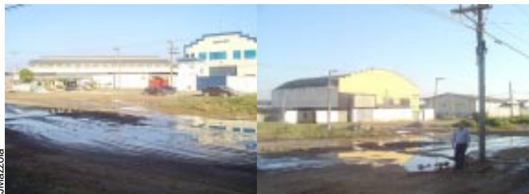
Uma vala de mau cheiro e lama foi formada em frente ao 720 da Guinle

Um esgoto a céu aberto em duas extremidades da Guinle impede o tráfego de carros e caminhões que precisam desviar da imensa cratera forma-