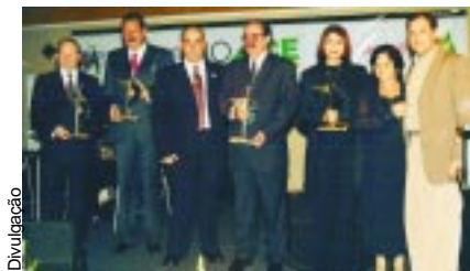
Prêmio destaque 2003

Segundo votação ocorrida no dia 22 na ACE, os agraciados deste ano são: no seg-