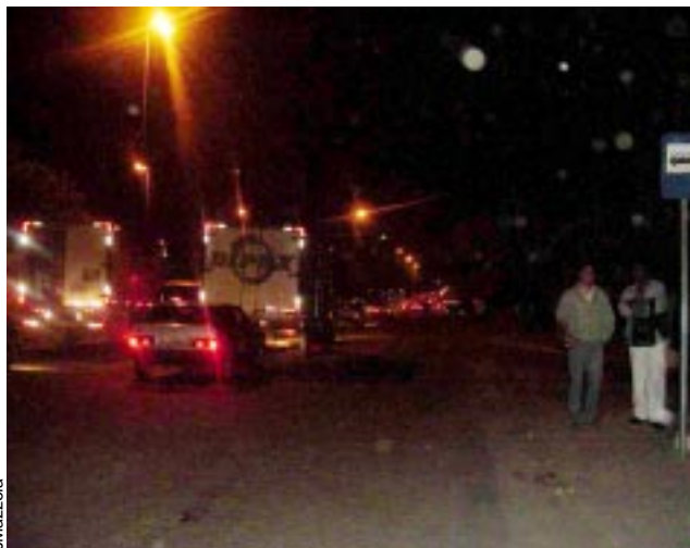
Falta de luz ao longo do viaduto causa insegurança

A Empresa tem interesse em ampliar o número de unidades consumidoras, pois nisso consiste o seu ne-