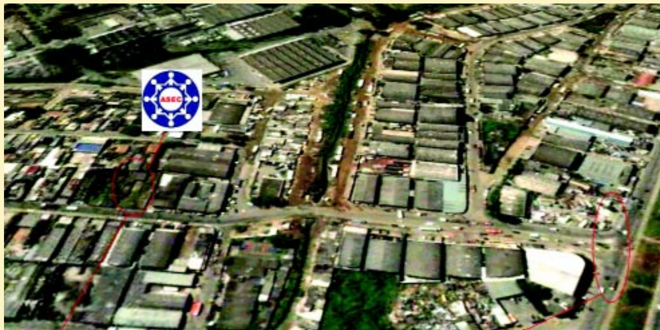
Terreno da ASEC na Av. Nova Cumbica

Após a aprovação em assembléia geral extraordinária pelos associados da ASEC, foi formalizada a compra de um terreno com 800 m 2 na avenida Nova Cumbica, para a construção da futura sede da entidade, que será denominada “Casa do Empresário”. Essa medida representa a concretização do sonho de muitos empreendedores que acreditavam e acreditam que a região de Cumbica poderia ser bem melhor, mas para isto necessitam de uma entidade forte, isenta e comprometida com os empresários e toda a população de nossa cidade.