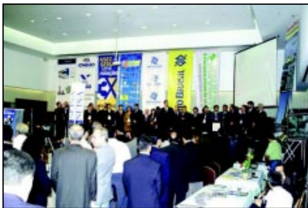
Rodada de Negócios realizada em julho último, reunindo toda a classe empresarial

Cada participante fará contato com todas as demais, tendo um tempo pré-determinado para expor seu produto ou serviço aos convidados, com grande projeção e potencial de aquisição dos mesmos. São as chamadas “empresas âncoras”. Os empresários