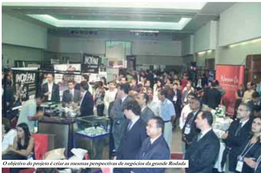
O objetivo do projeto é criar as mesmas perspectivas de negócios da grande Rodada