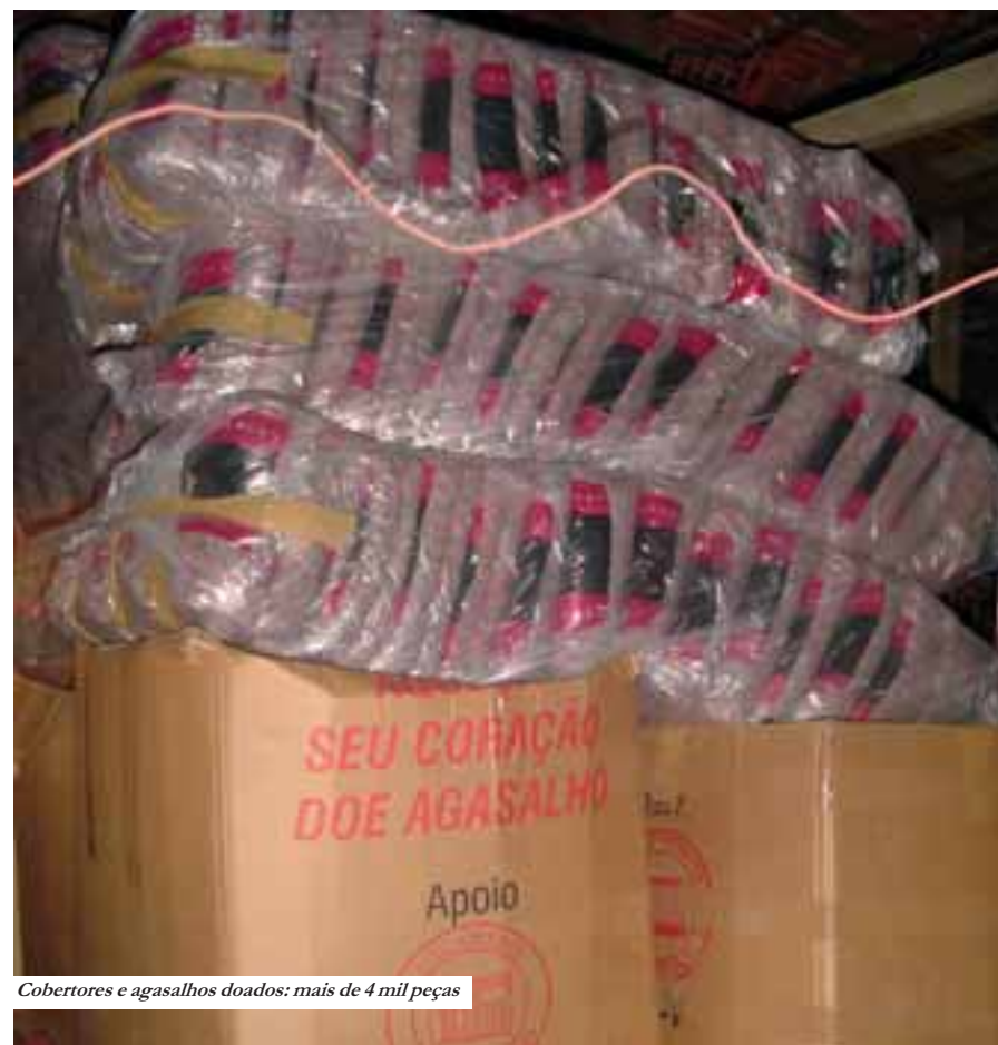
Cobertores e agasalhos doados: mais de 4 mil peças

Açotubo, Açovisa, AIR Liquide, AMAM, Aresta, Aro, ASF Júnior, Auto Posto Maluli, Banco Real, Bometal, Brasfond, Braspar, Citromax, CLD, Correios Biagini, Cosmopolitan, Cromadora Racional, CVF Metalúrgica, Dalmaso, Dan – Top, Degani Vaduz, Delmac, Dental Center - Unidades I, II, III e IV, Depósito Aliança, Derpac, Dinaferro, DispaFilm, Drogaria Otoya Sato, Equipe Freios, Espiroflex, Estamac, Feriotti, Ferramentaria Damp, Finoplastic, Fitas Elásticas Estrela, Fitas Metálicas, Flaumar, Fundalumínio, Gerdau, GG Port, GL Laboratórios, Gotaquímica, Gradimetal, Granitos Brasileiros, Harlo do Brasil, Hod Kether, Inox-Par, Itetal, Joalmi, Linciplás, Link Plásticos, Locar, Majestic, Mastertemp, Maxi-Cut, Metalacre, Microlins, Neveli, Nobre Metais, NSA Recauchutagem, Ótica Stella, PH Odontologia, Pom Pom, Qualiman, Real Quartzoz, Recriis, Restaurante e Churrascaria Cumbicenter, Rhowanyll, River Motor, Rosset, Ruscken, Sabor & Cia, Sigla Borrachas, Trefilação Bandeirantes, Usinagem Maxius, Vidrax, Zektor, Zeus.