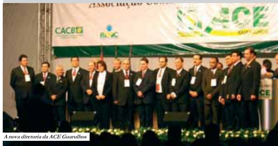
A nova diretoria da ACE Guarulhos