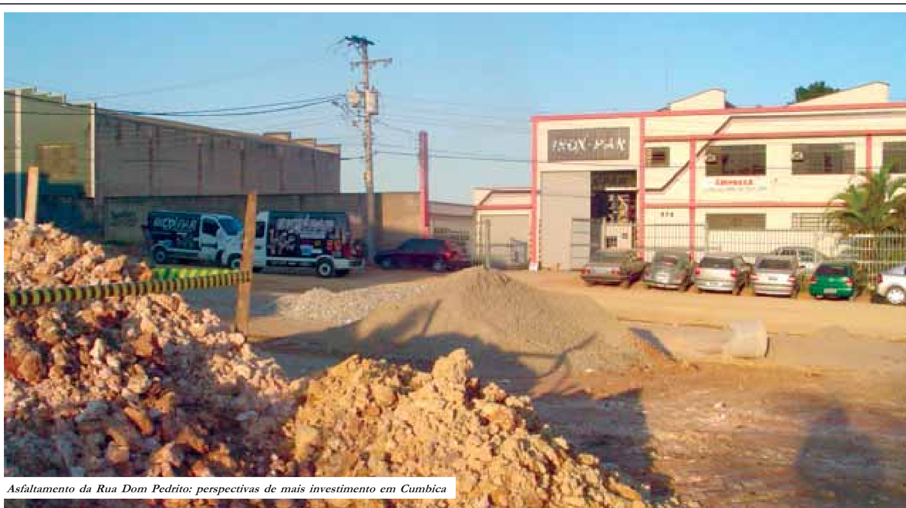
Asfaltamento da Rua Dom Pedrito: perspectivas de mais investimento em Cumbica

Os frutos da luta travada pela ASEC em seus 18 anos de história começam a aparecer. Após contundentes embates entre a entidade e o Poder Público, o diálogo entre ambos passou a ser feito na mesma linha de pensamento. Resultado: diversas obras já estão previstas para Cumbica. Além da já anunciada implantação da alça de acesso à Rodovia Presidente Dutra sentido Rio de Janeiro, asfaltamento de vias em parceria com as empresas e um projeto habitacional fazem parte do plano de revitalização