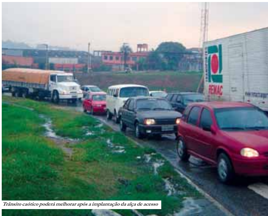
Trânsito caótico poderá melhorar após a implantação da alça de acesso

Após publicações no ASECpress e apoio de vereadores, prazo para a entrega da obra é estipulado