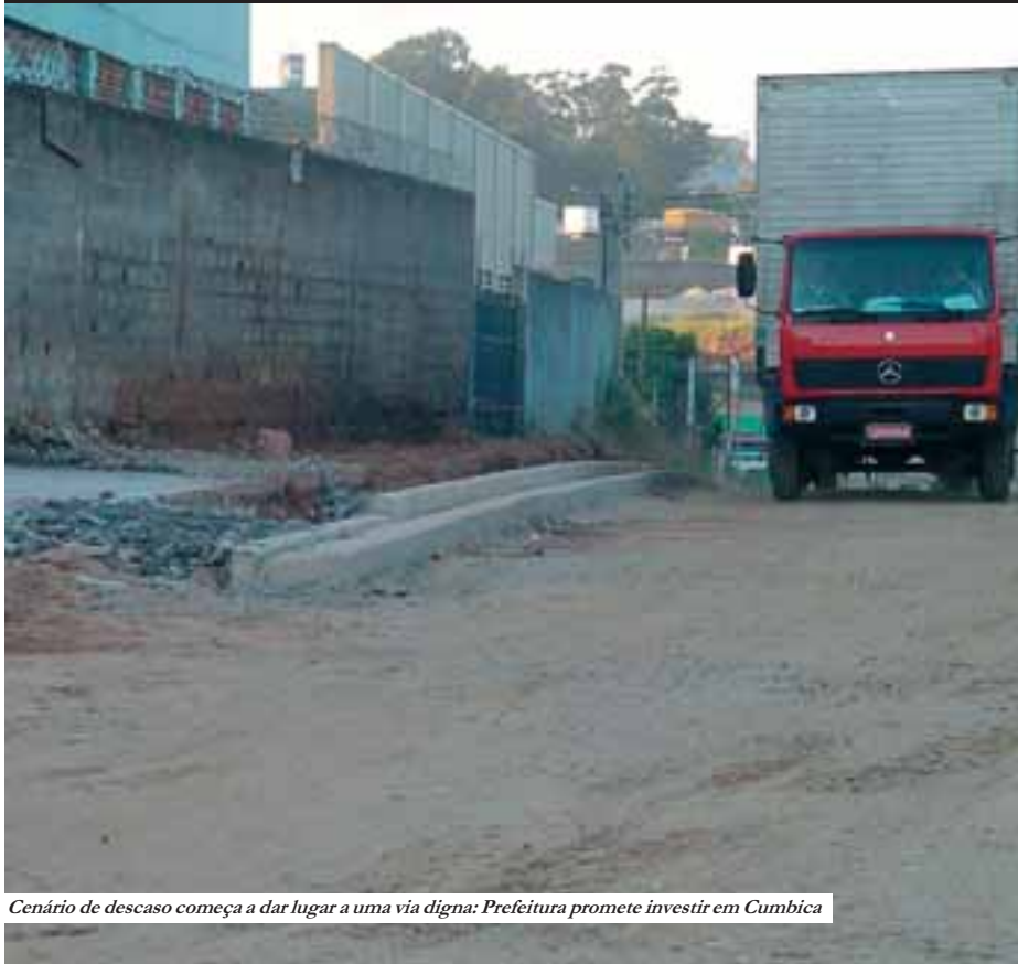
Cenário de descaso começa a dar lugar a uma via digna: Prefeitura promete investir em Cumbica

serviço) obterão satisfação pela realização de suas atividades. Esse asfalto representará algo talvez imensurável: a satisfação de exercermos nossas atividades com mais estima e alegria”.