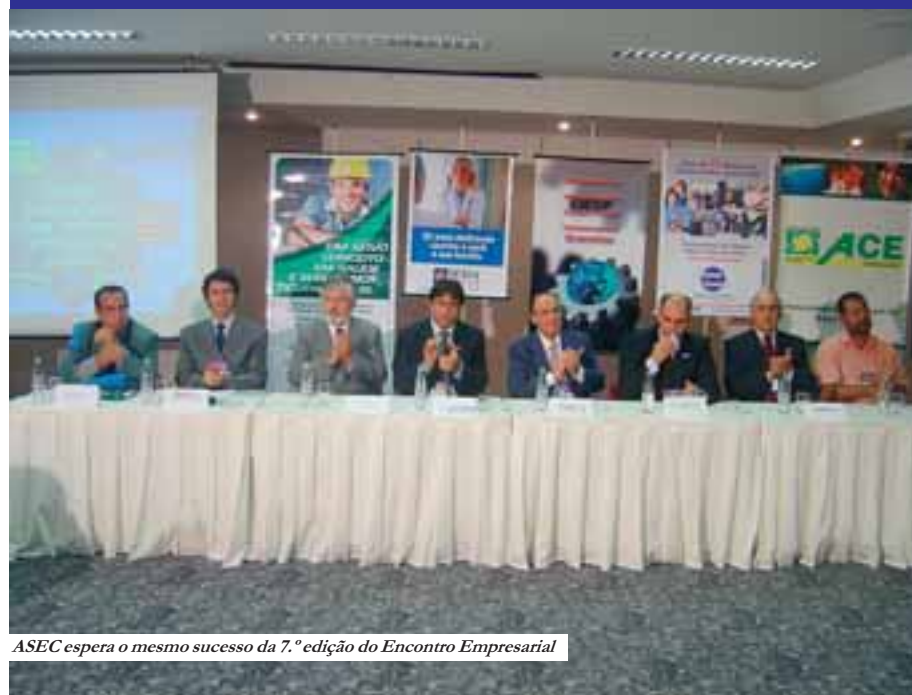
ASEC espera o mesmo sucesso da 7.ª edição do Encontro Empresarial