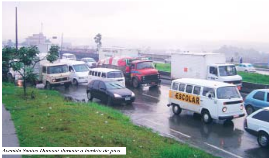
Avenida Santos Dumont durante o horário de pico

Apesar de algumas melhorias, trevo de Cumbica ainda é um problema sem solução