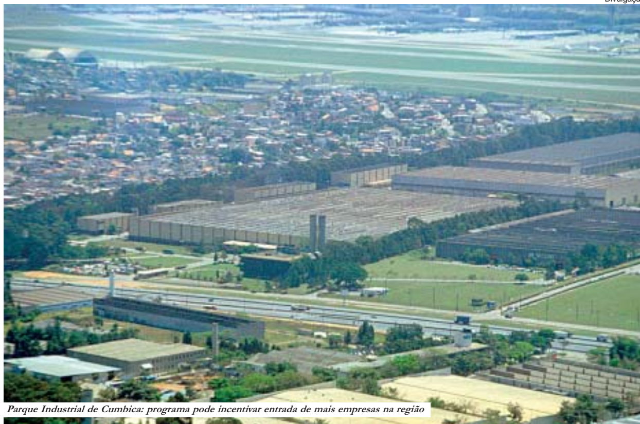
Parque Industrial de Cumbica: programa pode incentivar entrada de mais empresas na região

Programa que oferece incentivos fiscais e tributários é atrativo para a instalação de novas empresas e a expansão das que já estão na cidade