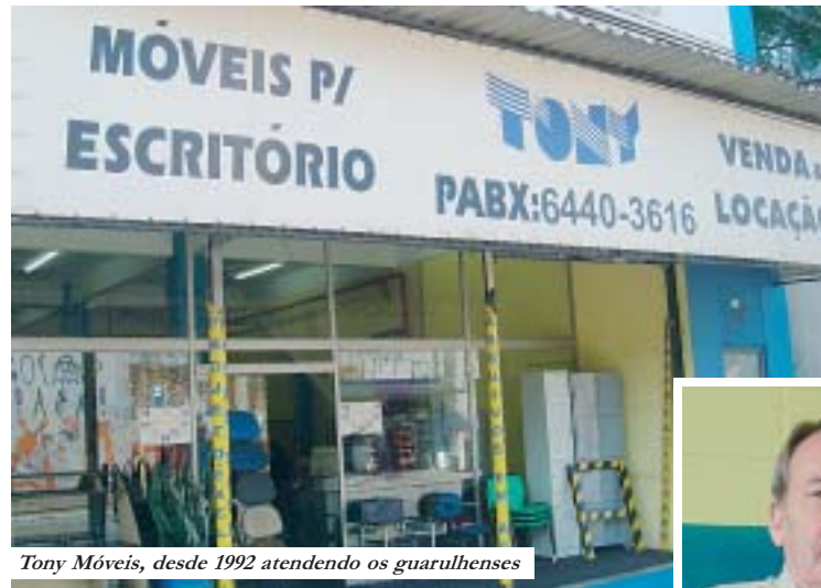
Tony Móveis, desde 1992 atendendo os guarulhenses

Há 13 anos em Guarulhos, a empresa já fez dos clientes, amigos, e tem a lealdade como o pilar mais importante