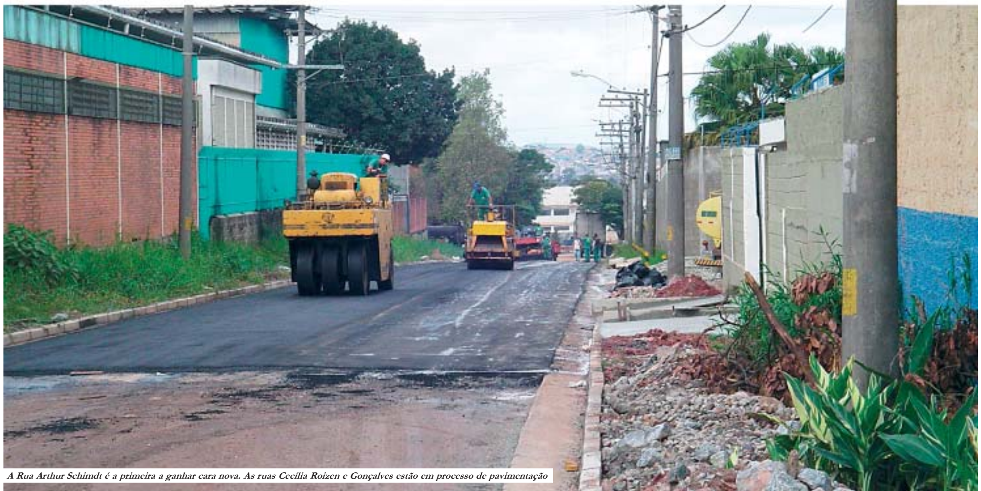
A Rua Arthur Schmidt é a primeira a ganhar cara nova. As ruas Cecília Roizen e Gonçalves estão em processo de pavimentação