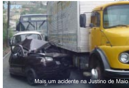
Mais um acidente na Justino de Maio

Procurada, a Secretaria de Transportes e Trânsito, por meio de sua assessoria de imprensa, esclarece que um estudo já foi feito na região e não dá para proibir o tráfego nesta via, a solução é a pavimentação da Rua Manoel Vitorino que é menos acentuada. A pavimentação está na programação, mas sem data para execução. Uma medida paliativa e emergencial foi a reserva de uma das três faixas da Santos Dumont para que o trânsito flua normalmente e os caminhões consigam subir.