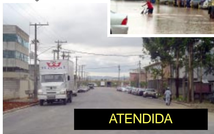
Rua da Lagoa

As edições do ASEC PRESS estão disponíveis no nosso site: www.asec.org.br