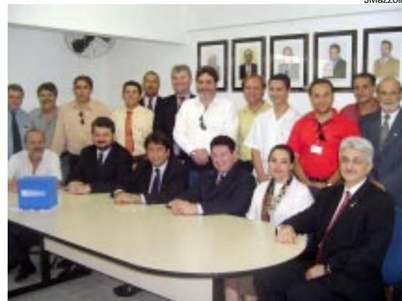
Nova diretoria e colaboradores pós votação

O grupo foi escolhido por eleitores (associados) que compareceram à sede da Asec. A posse da nova diretoria acontecerá no 6º Encontro Empresarial Cumbica em Movimento no dia 7 de dezembro.