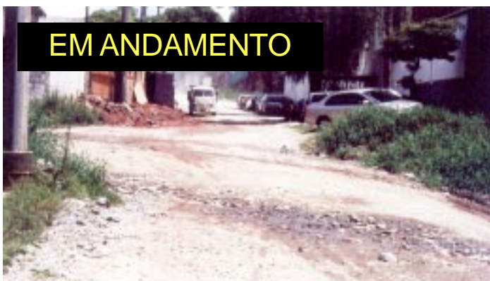
Rua Arthur Carl Schmidt